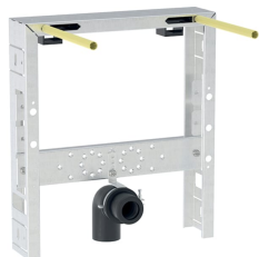
Figura di esempio